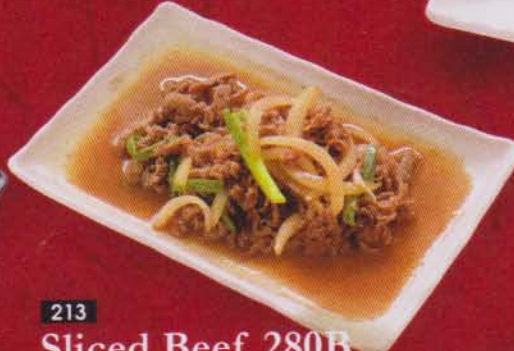
213 Sliced Beef 280B 牛焼き肉 / สไลด์ บีฟ เทริยากิ เนื้อสไลด์บาง ย่างซีอิ้วหวาน