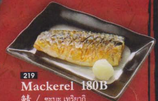
219 Mackerel 180B 鯖 / ซะบะ เทริยากิ ปลาซะบะย่างซีอิ้วหวาน