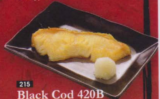
215 Black Cod 420B 銀鱈 / กิ้นคาระ เทริยากิ ปลาหินย่างซีอิ้วหวาน