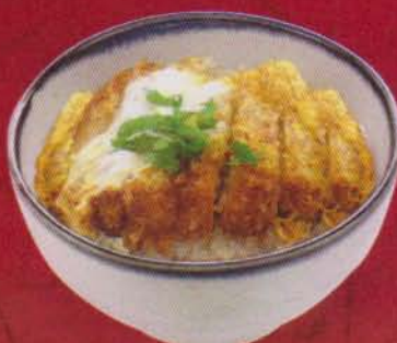
285 Katsu Don 220B カツ丼/คัทสึ ดั่ง Breaded Pork Covered with Egg ข้าวหน้าหมูทอด