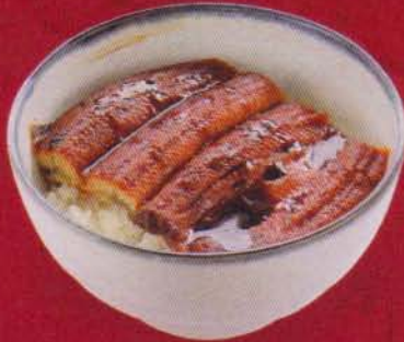
282 Una Don 480B 鰻丼/อูนา ดั่ง Grilled Eel ข้าวหน้าปลาไหลญี่ปุ่น