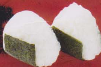
291 Okaka /おかか/ โอนิกิริ โอะกะกะ 50B Bonito Flakes ข้าวปั้นสามเหลี่ยมใส่ปลาแห้ง