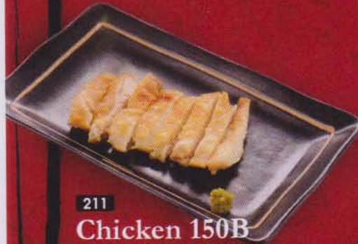
211 Chicken 150B 若鶏塩焼き / ชิคเก้น เทริยากิ ไก่ย่างซีอิ้วหวาน