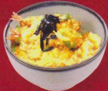
283 Tentoji Don 270B 天とじ丼/เทนโทจิ ดั่ง Tempura Covered with Egg ข้าวหน้าเทมปุระรวมไข่