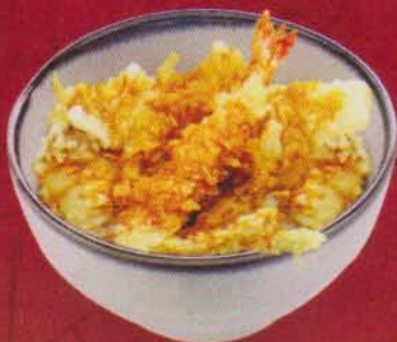
284 Ten Don 250B 天丼/เทน ดั่ง Tempura ข้าวหน้าเทมปุระรวม