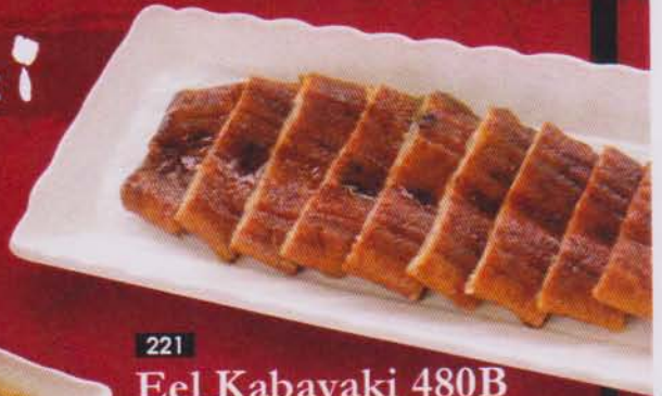
221 Eel Kabayaki 480B 鰻蒲焼き / อิล คาบายากิ ปลาไหลญี่ปุ่นย่าง