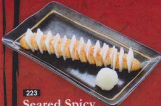
223 Seared Spicy Cod Roe 280B 明太子焼き / ยากิ เมนไตโอะ ไข่ปลาโคโรมาดองเผ็ดย่าง