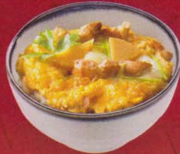
286 Oyako Don 180B 親子丼/โอยาโก ดั่ง Chicken Covered with Egg ข้าวหน้าไก่ราดไข่