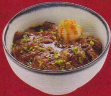
281 Steak Don 550B ステーキ丼/สเต็ก ดั่ง Beef Steak ข้าวหน้าเนื้อสเต็ก